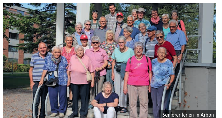
Seniorenferien in Arbon