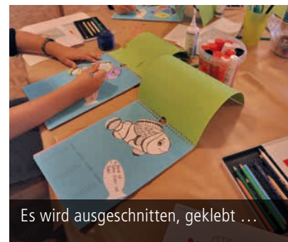
Es wird ausgeschnitten, geklebt ...