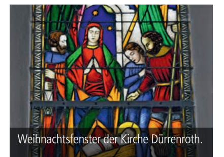
Weihnachtsfenster der Kirche Dürrenroth.

chern und lüften, Arznei geben und nehmen, Orte meiden, wo man mich nicht braucht, damit ich nicht andere vergifte und anstecke und ihnen durch meine Nachlässigkeit eine Ursache zum Tode werde. Wenn mein Nächster mich aber braucht, so will ich weder Ort noch Person meiden, sondern frei zu ihm gehen und helfen. Siehe, das ist ein gottesfürchtiger Glaube, der nicht tollkühn und dumm und dreist ist und Gott nicht versucht.»