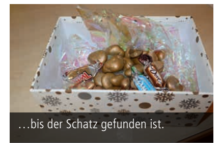
...bis der Schatz gefunden ist.