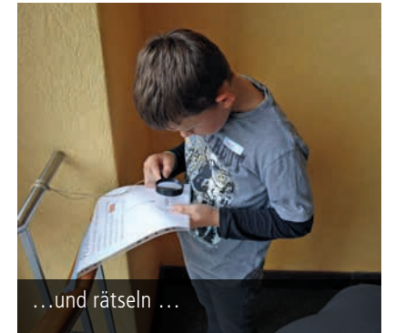
...und rätseln ...