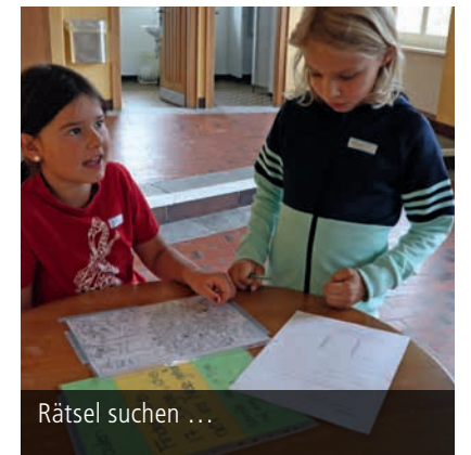
Rätsel suchen ...