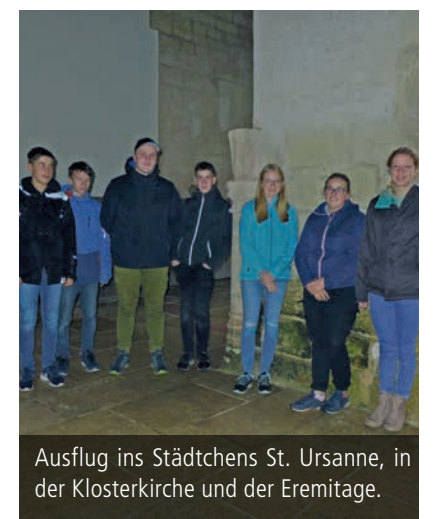
Ausflug ins Städtchens St. Ursanne, in der Klosterkirche und der Eremitage.