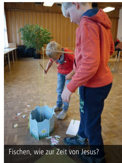
Fischen, wie zur Zeit von Jesus?

Enthält die Bibel einen Schatz? Was bedeutet es, dass die Bibel von einem Schatz spricht? Wir machen uns zusammen auf die Suche und wollen den Schatz entdecken!