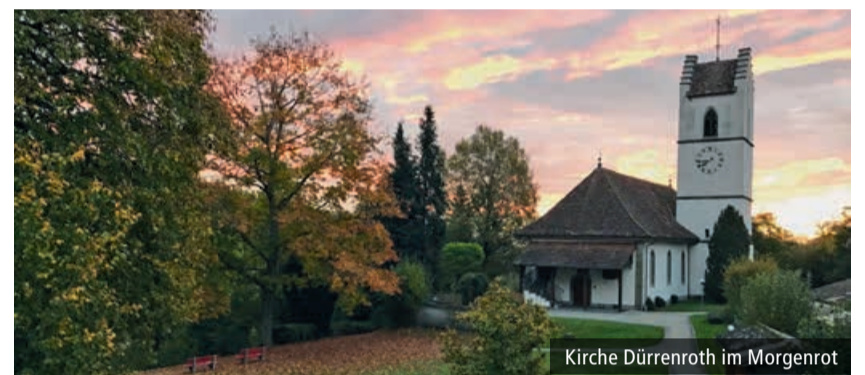
Kirche Dürrenroth im Morgenrot