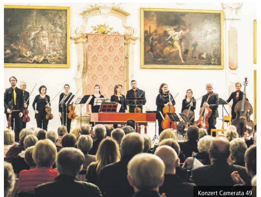
Konzert Camerata 49

4. November statt. Ihre Gedanken, ihre Sprache und ihr Mittragen sind gefragt. Um sich auf die Predigtwoche einzustimmen zu können, ist am 11. Oktober 2018 um 20.00 Uhr im Mehrzweckraum Eriswil ein Informationsanlass zu Thema «Vision 21» geplant. Der Kirchgemeinderat und Pfr. Yves Schilling freuen sich auf ihr zahlreiches Kommen.