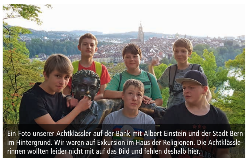
Ein Foto unserer Achtklässler auf der Bank mit Albert Einstein und der Stadt Bern im Hintergrund. Wir waren auf Exkursion im Haus der Religionen. Die Achtklässlerinnen wollten leider nicht mit auf das Bild und fehlen deshalb hier.