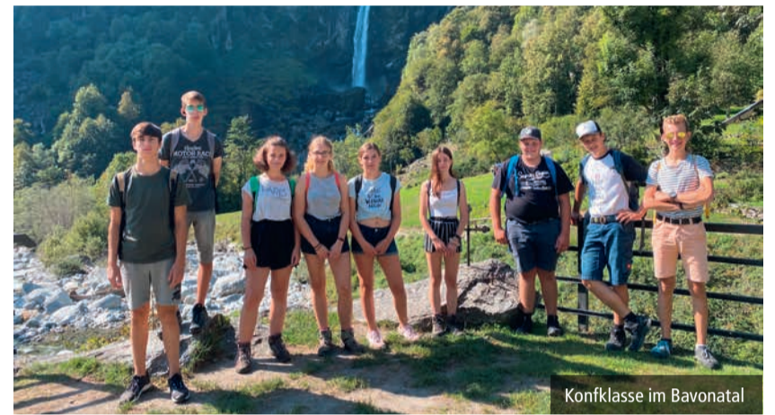
Konfklasse im Bavonatal

Aufbruch nach Locarno – Santa Maria Assunta – Was ist Glück? – Vogelflug – Ankunft in Moscia – Jesus in der Wüste: Was zählt? – Nachspaziergang nach Ascona – Aufbruch ins Bavonatal – Baden, Schwitzen, Geschichten hören – Wie lange geht's noch? – Panne in Bignasco – Nabe und Felge des Glückrads – Film – Der verlorene Sohn bei den Säulen, Hans im Glück, Konfirmanten im Lido – Glücklich ihr Armen? – auf dem Kreuzweg – auf dem Heimweg.